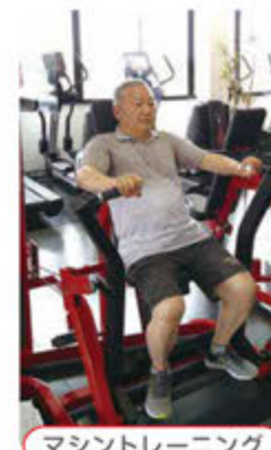
マシントレーニング