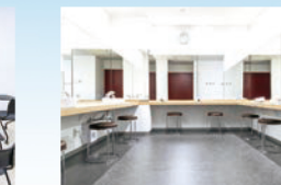
パウダースペース