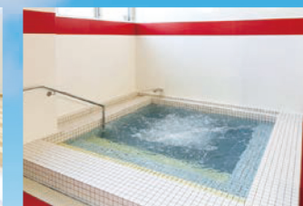
プールジャグジー