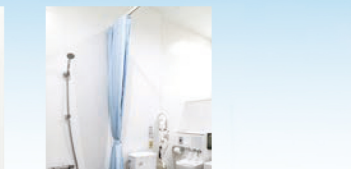
多機能トイレ (オストメイト対応)