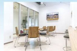
休憩スペース（おとな会員専用）